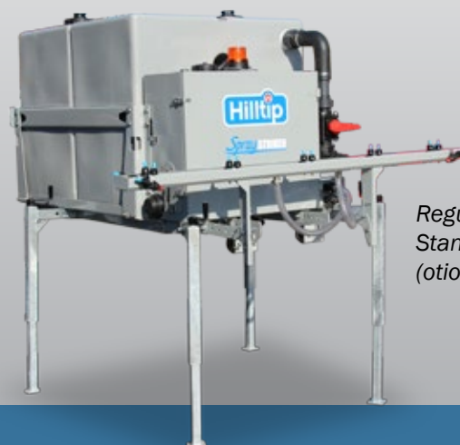
Regulierbare Standbeine (optional)