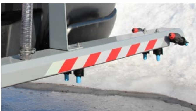
Doppelte Sprühdüsen für Enteisung selbst bei hohen Geschwindigkeiten

Abstellsystem für ein leichtes auf und abladen bzw. Lagern des Gerätes