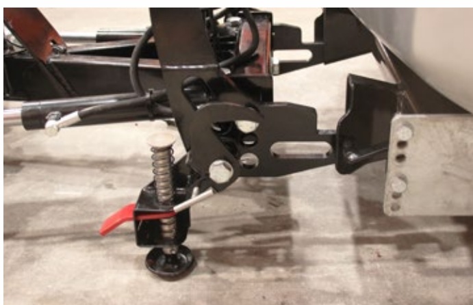
Hilltip Quick hitch Schnellmontagesystem