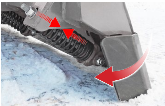
Schürfleiste mit Absorber-Federn