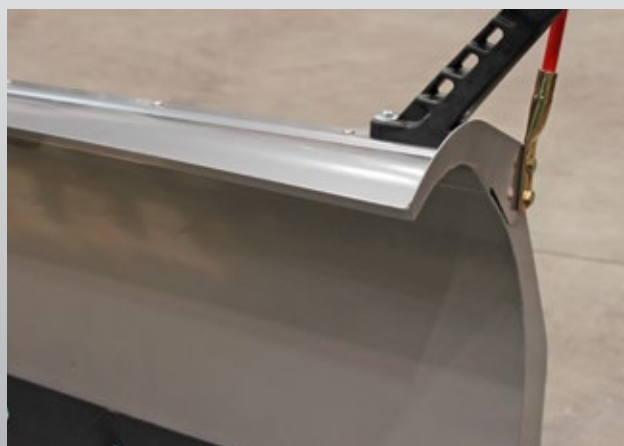
Stahl-Schneeabweiser für Gerade-Pflug (optional)